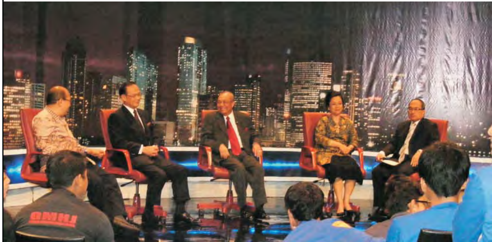
Suasana siaran langsung Economic Challenges Metro TV dengan tema 'Perekonomian Nasional dan Daya Saing Bangsa' (29/11)

Oktober 2010 kemarin, tepat setahun usia Kabinet Indonesia Bersatu (KIB) II. Semua jajaran pemerintahan mulai dari presiden hingga para menteri memaparkan pekerjaan beserta hasil yang telah dicapai selama setahun berkiprah. Tidak terkecuali Kementerian Perencanaan Pembangunan Nasional/Badan Perencanaan Pembangunan Nasional (Kementerian PPN/Bappenas).