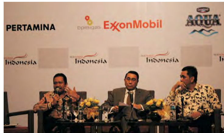
Para pembicara sedang menjawab pertanyaan para peserta KNH 2010

Untuk itu, lanjut Heri, perlu sebuah peta jalan ( road map ) untuk menapaki jalan menuju PR Indonesia yang profesional. Tahapan road map adalah penguatan organisasi PR di Indonesia, penguatan profesi PR, penerapan nilai dan prinsip PR, implementasi platform , hukum, dan etika Kehumasan, serta penguatan industri PR. "Jika road map ini bisa digerakkan sinergis dan dilaksanakan secara konsisten, PR Indonesia yang profesional hanya tinggal menunggu waktu," ungkap Heri.