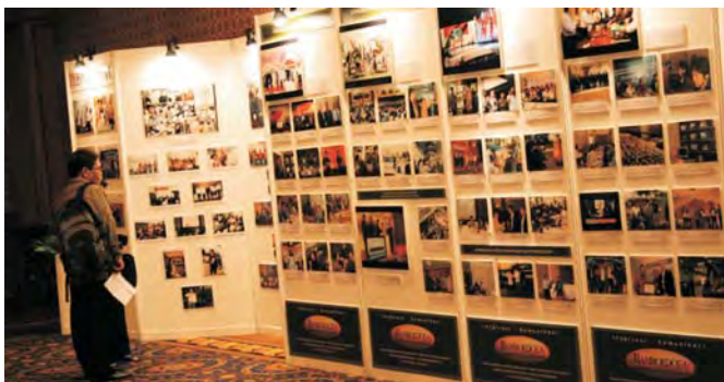
Seorang peserta sedang mengamati foto-foto yang dipamerkan pada Pameran Foto KNH 2010

Ada yang beda dari gelaran Konvensi Nasional Humas 2010 kali ini. Selain disugukan presentasi dan pemaparan dari banyak pakar, para peserta juga dapat menyaksikan pameran foto-foto apik dan menarik yang berisi aktivitas institusi-institusi anggota Perhumas, perusahaan swasta dan BUMN. Dengan layout panel yang interaktif dan pencahayaan yang pas, pameran ini mendapat banyak perhatian dari para peserta KNH.